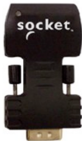
コードレス シリアル アダプター

http://www.cfcompany.co.jp/product/socket/Cordless_Serial_Adapter.html